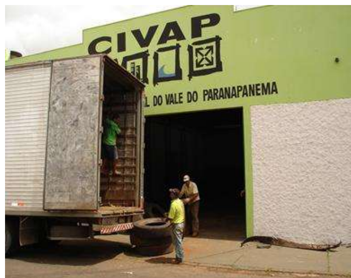
FIGURA 14: Carregamento de pneumáticos.

As entregas dos resíduos são agendadas junto ao CIVAP conforme capacidade de recebimento do barracão e programação de retirada dos resíduos para destinação final.