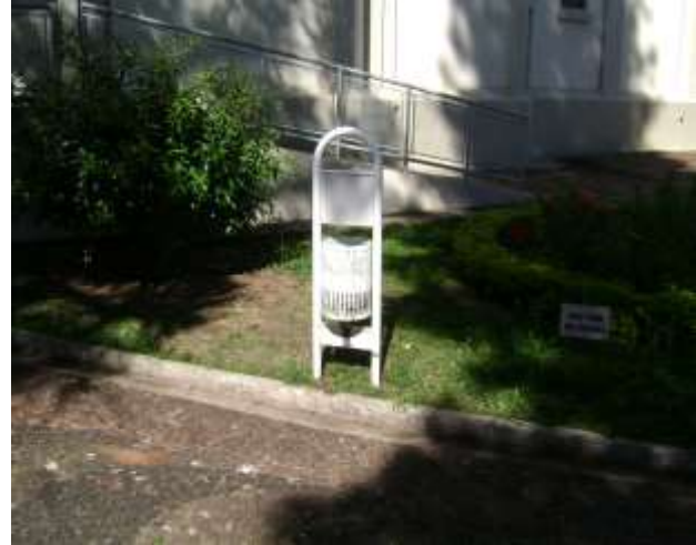
FIGURA 07: Lixeira disposta em Praça em Echaporã.