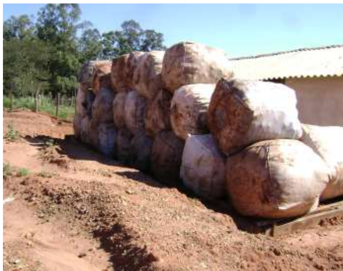
FIGURA 10: Bags com material reciclável em Echaporã.

No município de Echaporã, a coleta é realizada por autônomos e os resíduos recicláveis são armazenados em um barracão cedido pela prefeitura, localizado na Rodovia SP 333,s/n km 350, atrás da Associação Dos Produtores Rurais do Município de Echaporã-Aprume .