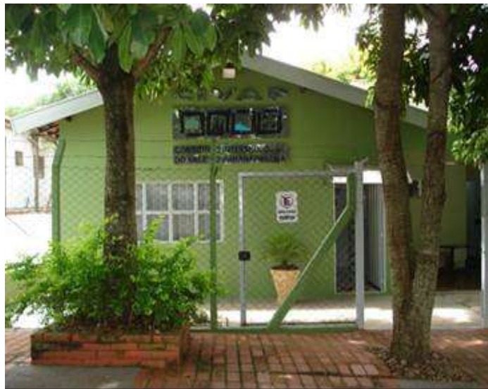
FIGURA 01: Sede do Civap em Assis, SP.

Em Novembro de 2000 foi deliberada pelo Conselho de Prefeitos a alteração da denominação do Consórcio, que passou para CONSÓRCIO INTERMUNICIPAL DO VALE DO PARANAPANEMA – CIVAP e em Dezembro de 2001, foi deliberada também a criação do Consórcio Intermunicipal do Vale do Paranapanema/Saúde – CIVAP/SAÚDE para atuar especificamente na área da saúde.