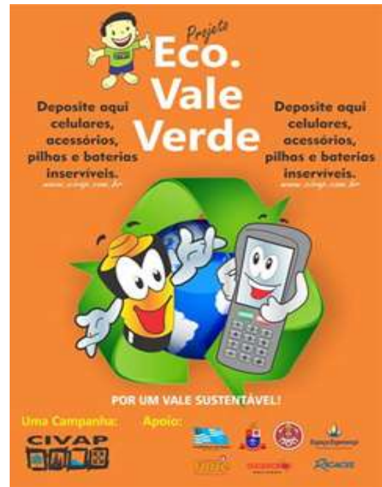
FIGURA 15: Adesivo da campanha Papa-pilhas.

Verificou-se em visita a campo pelos técnicos do CIVAP, a falta de programas específicos para a coleta dos resíduos de lâmpadas fluorescentes, bem como a falta de pontos de entrega voluntária.