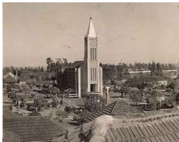
FIGURA 02: Echaporã na década de 30.

Em 30 de novembro de 1944, com a emancipação dos diversos distritos originais, sua área original foi diminuída e Bela Vista foi batizada de Echaporã (do tupi-guarani, “olhar belo”).