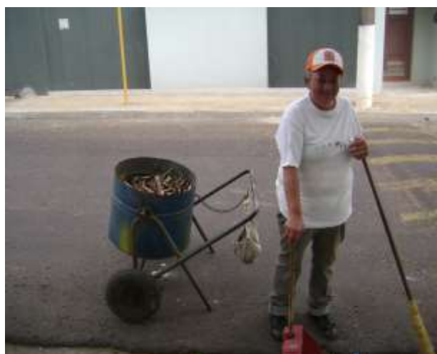
FIGURA 11: Serviço de varrição em Echaporã.

Os trabalhos ocorrem das 7h00min às 10h00min, iniciando-se na área central da cidade e segue para os demais bairros.