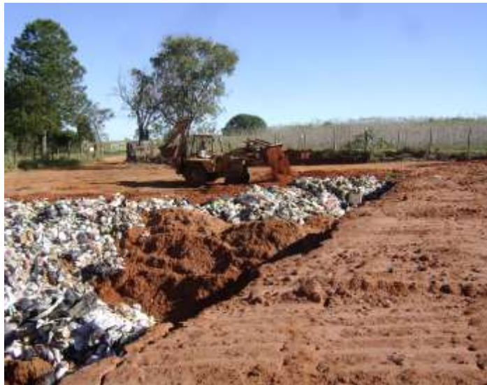
FIGURA 09: Aterro em valas de Echaporã.

A infraestrutura do aterro apresenta apenas cerca de divisa, monitoramento de vetores (roedores e insetos) e cobertura imediata dos resíduos após sua deposição.