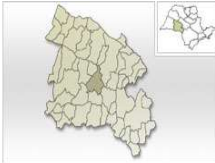
MAPA 01: Localização do município de Echaporã no Oeste Paulista.

Está situado a uma altitude de 700 metros em relação ao nível do mar (CEPAGRI), e possui uma superfície de 515,43 Km 2 (SEADE, 2013).