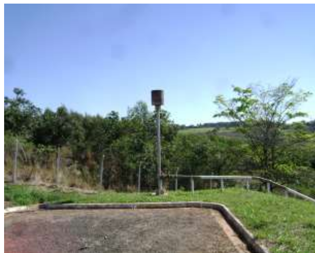
Figura 04: Flare para queima e transformação de metano em dióxido de carbono na ETE de Echaporã.