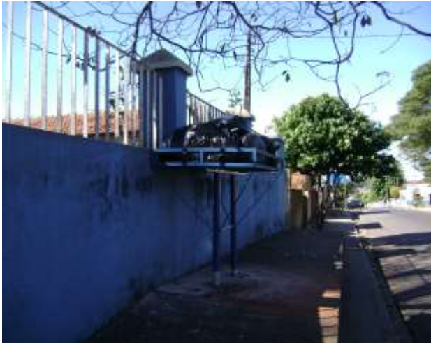
FIGURA 06: Lixeira em frente à Posto de Saúde em Echaporã.

Na região central do município, estão dispostas 24 lixeiras em pontos estratégicos para atender a maior circulação de pessoas e outras 05 lixeiras estão dispostas em regiões afastadas do centro, num total de 29 lixeiras.