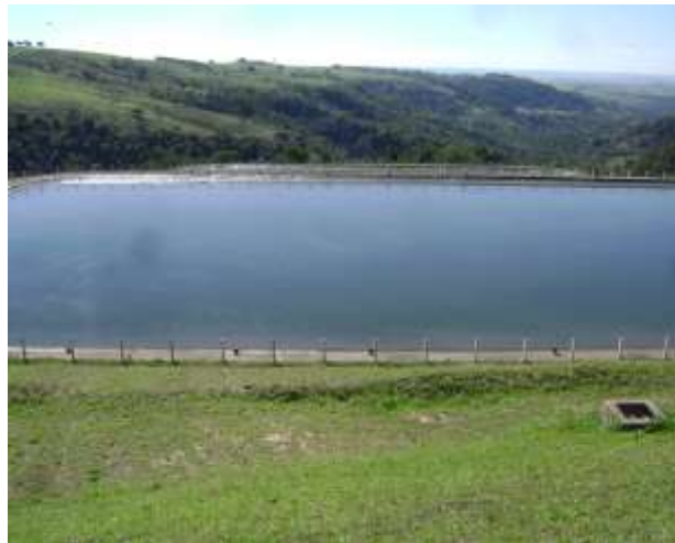
Figura 05: Lagoa facultativa de maturação para tratamento de esgoto de Echaporã.