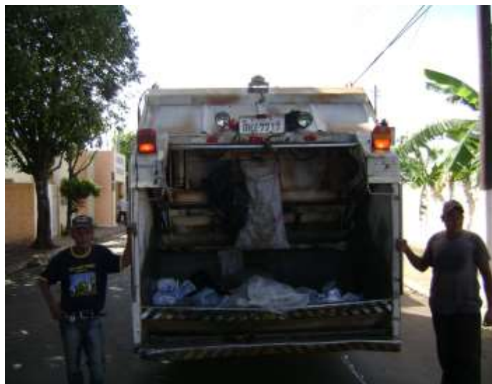
FIGURA 08: Coleta convencional em Echaporã.

Antigamente, a disposição de resíduos sólidos domiciliares de Echaporã era realizada no aterro em valas localizado no Sítio Vista Alegre, Zona Rural, Echaporã, SP, com Licença de Operação protocolada desde junho de 2005.