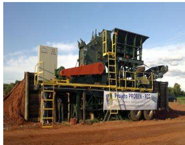
FIGURA 12: Equipamento de beneficiamento de resíduos da construção civil.

Porém, o equipamento ainda não visitou o município de Echaporã, pois este, apesar de ter um parecer técnico nº 59100035, para armazenamento temporário dos resíduos da construção civil, ainda não dispõe da rampa de acesso ao britador e das sapatas em concreto armado para a instalação do equipamento.