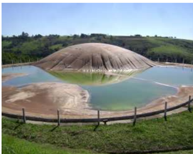
Figura 03: Lagoa aeróbica para tratamento de esgoto de Echaporã.

O município ainda não possui plano de saneamento básico conforme a lei 11.445 de 05 de janeiro de 2007, que abrange tratamento de água, tratamento de efluentes sanitários, macro drenagem urbana, e resíduos sólidos, este último em maneira mais aberta, tendo uma visão macro da geração e destinação destes.